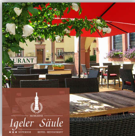
Hotel Igeler Säule