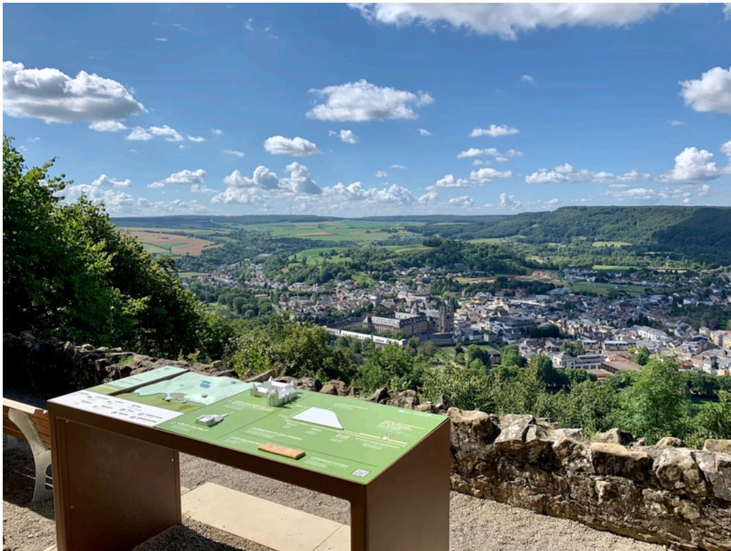
Barrierefreier Aussichtspunkt Liboriuskapelle mit Tastmodell