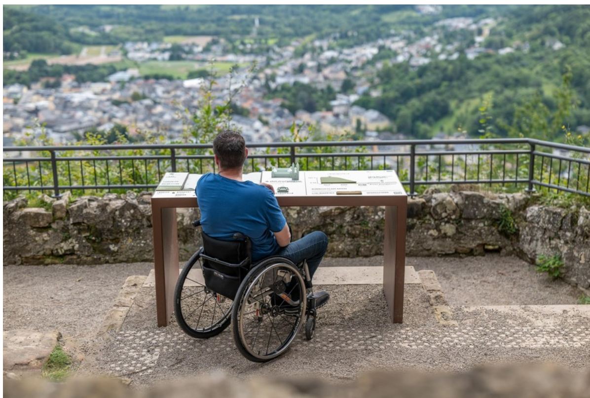
Barrierefreier Aussichtspunkt Liboriuskapelle mit Tastmodell